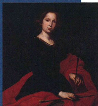
Sant'Orsola - Olio su tela