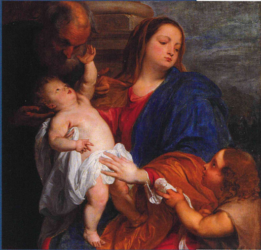
Sacra Famiglia con san Giovannino Olio su tela